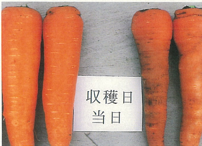
収穫日当日の根部の状況 左：正常株 右：欠乏症発生株