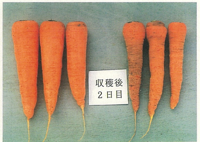
収穫後2日目の根部の状況 左：正常株 右：欠乏症発生株