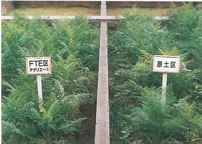
播種後3ヶ月頃の生育状況